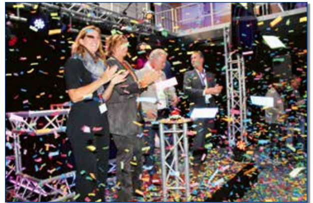
De 'rode-knop-drukkers' bewonderen het effect van hun openingshandeling...