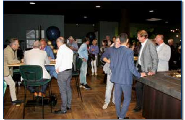
Het openingsfeest werd volop gebruikt om met elkaar bij te praten.