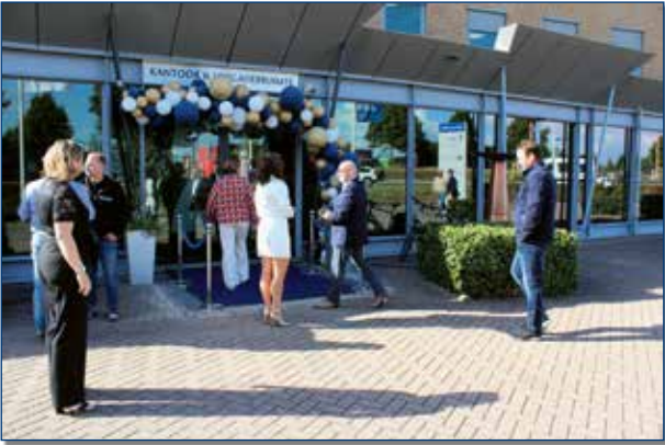
Bij de entree stond een welkomstcomité klaar om alle gasten warm te onthalen.

Tijdens de opening kon je over de hoofden lopen. Daarom hebben we zowel foto's van de opening als een kleine beeldimpresie van ons pand zonder de honderden bezoekers. Mocht je het nieuwe 'clubgebouw' nog niet gezien hebben, maar ben je een keer in de buurt? Voel je welkom om een kop koffie te komen drinken!