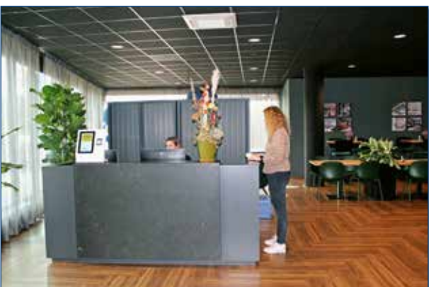
Onze nieuwe receptie heeft een fraai natuurstenen front, gerealiseerd door Buddingh Natuursteen.