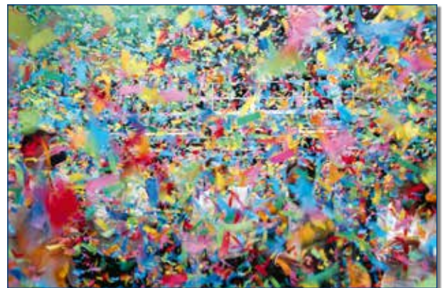
En zo ervoeren alle gasten op de begane grond het confettimoment.