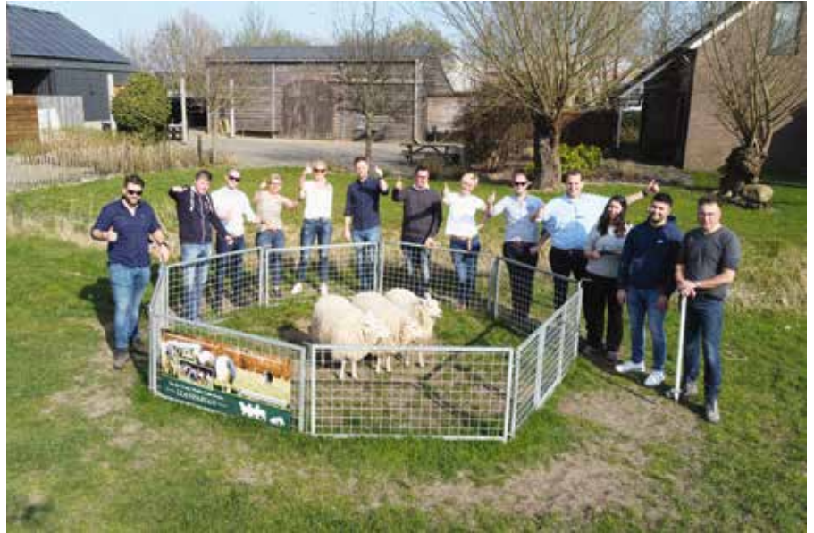
Vol trots poseert de groep bij de bijeen gedreven schapen