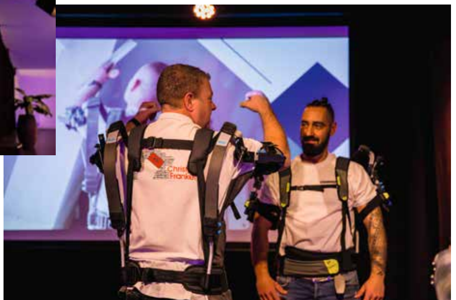
Cis en Gio, beide teststukadoors van het praktijkonderzoek, demonstreerden én presenteerden vol enthousiasme en passie het exoskelet.