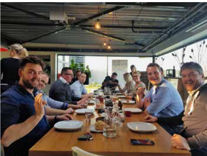
Een zeer leerzame, geslaagde dag!