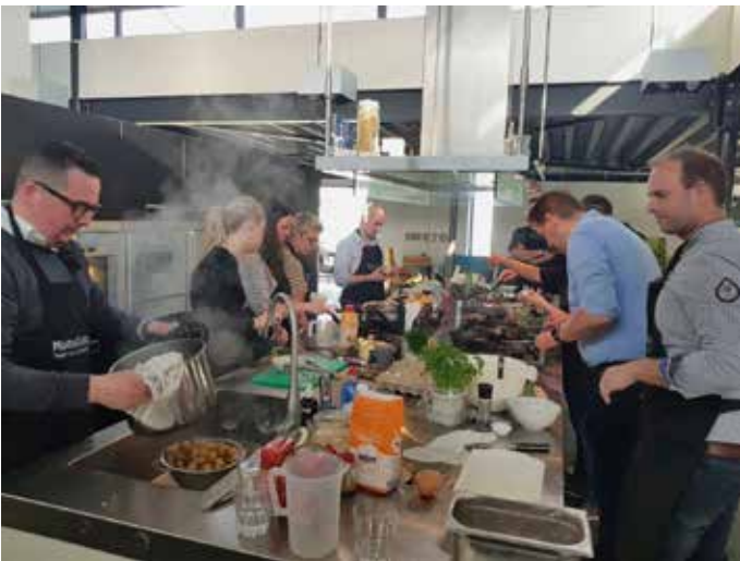
Hoe creëer je een ontplofte keuken? Nodig NOA Jong Talent uit ;-)