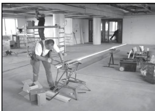
Figuur 5: Afkorten bandraster met ijzerzaag