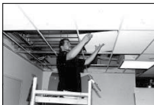
Figuur 6: Vulelementen in de draagstructuur leggen.