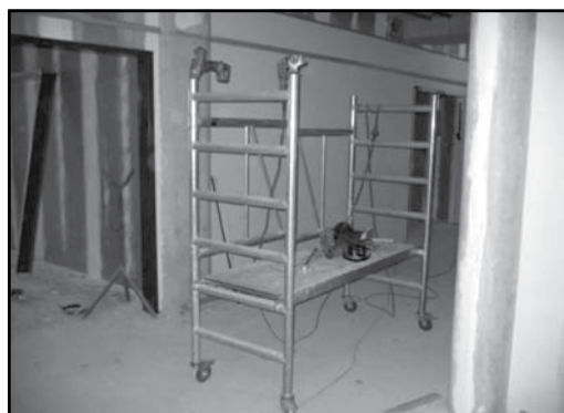
Figuur 2: Kamersteiger

De foto laat een kamersteiger zien. In de regel wordt een kamersteiger gebruikt met een breedte van 0,75 m (kan door een deur) en een lengte van 1,85 m. De hoogte waarop het werkplatform maximaal mag worden ingesteld bedraagt 2,50 m. Met een rolsteiger mag binnen tot maximaal 12,00 m. hoogte (= hoogte werkplatform) worden gewerkt.